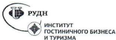
Рисунок 3 – Логотип ИГБ и Т РУДН

При составлении списка использованных источников необходимо соблюдать определенную последовательность в перечислении библиографических записей. Для отчета по практике наиболее приемлемыми являются алфавитные библиографические списки.