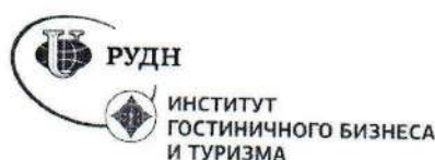
Рисунок 3 – Логотип ИГБ и Т РУДН

При составлении списка использованных источников необходимо соблюдать определенную последовательность в перечислении библиографических записей. Для отчета по практике наиболее приемлемыми являются алфавитные библиографические списки.