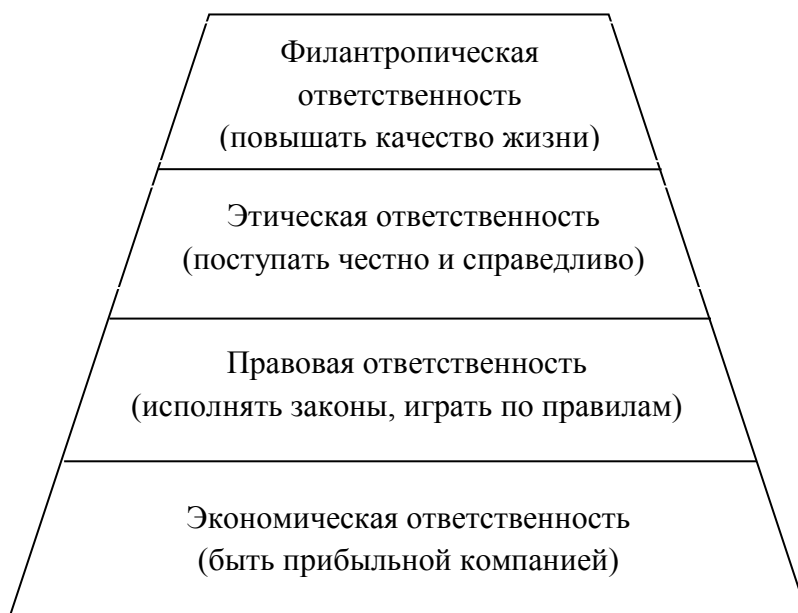
Рис. 1. Пирамида КСО по А. Кэрроллу

Лежащая в основании пирамиды экономическая ответственность связана с пристойным выполнением бизнес-структурами своей базовой функции по производству товаров и услуг, удовлетворяющих общественные потребности, и извлечению прибыли.