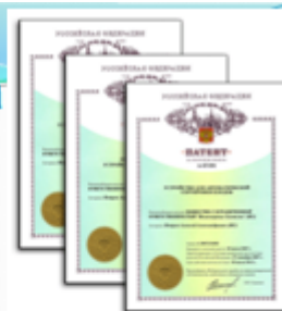
Патент слат. – открытое письмо с печатью

Действует на территории конкретной страны.