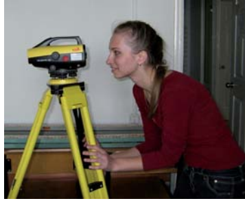
Leica Sprinter 100m, одночастотный GPS-приемник Leica GS20.

На кафедре геодезии были приобретены передовые геодезические приборы для сбора пространственных данных для геоинформационных систем, такие, как электронный тахеометр Leica TCR1205 R100, электронный нивелир