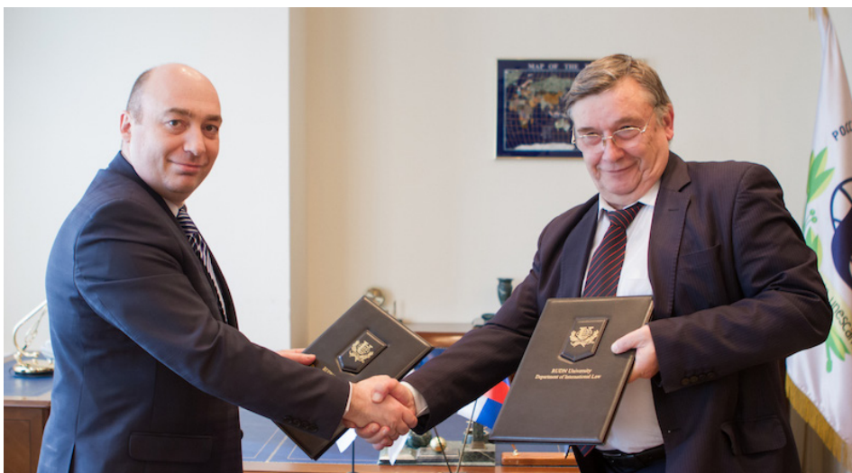
Подписание соглашения между РУДН и Российским Красным Крестом

Сложнее всего было, как ни странно, донести информацию о возможностях трудоустройства до студенческой аудитории, до выпускников текущего года. Для этого на каждом факультете и в каждом учебном институте созданы секторы по трудоустройству, включающие обучающихся из России, ближнего и дальнего зарубежья. Студенты сейчас активно помогают: распространяют новости о вакансиях среди обучающихся, занимаются информационным освещением нашей деятельности. С