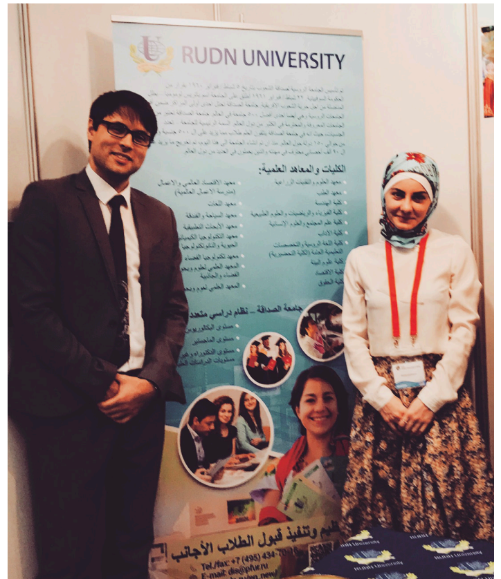
Соглашение о сотрудничестве между РУДН и Job For Arabists подписано в апреле 2017 г.

Будучи ещё студентом второго курса, я начал преподавать арабский язык как частный репетитор. Затем через год меня пригласили поработать в качестве редактора в арабской редакции государственной радиостанции «Голос России». Проработав там почти 6 лет, я прошёл интереснейшие этапы — от редактора до специально корреспондента. Даже в качестве диктора в течение одно-