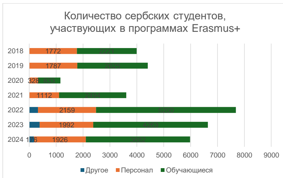
Рисунок 1 258 .

Безусловно, на снижение уровня безработицы влияет большое количество факторов, однако общий уровень образования населения закладывает основу для коренных изменений в обществе, поэтому его можно рассматривать в качестве одного из главных.