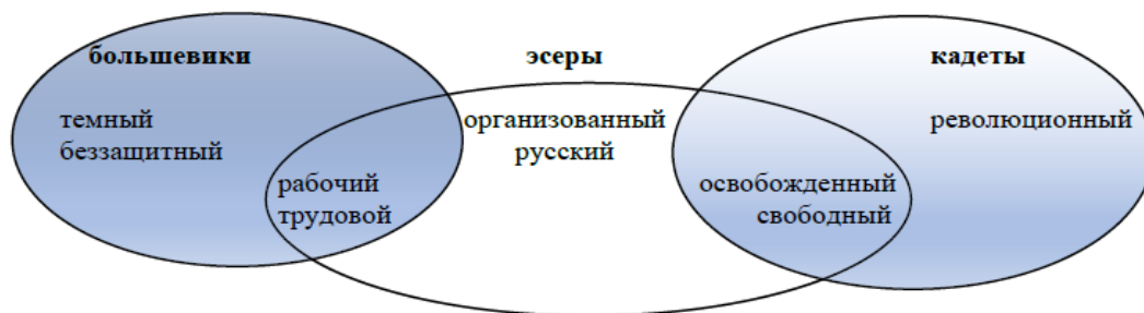
Схема 1. Сравнительная субмодель атрибутов номинации народ в печати политических противников.

Однако эта схема не отражает приоритетной направленности большевиков на рабочий класс, а эсеров – на крестьян.