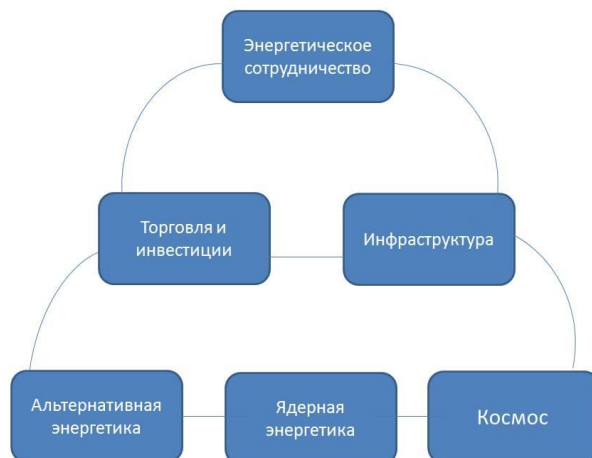
Рис. 1. Схематическая модель сотрудничества «1 + 2 + 3»

международное сотрудничество в области производства, строительства, инфраструктуры, торговли, инвестиций и финансов, ядерной энергии и новых ее источников, космоса, сельского хозяйства. Важным частью является описание модели сотрудничества по упомянутой ранее формуле «1 + 2 + 3» (см. рис. 1). Эту модель планируется положить в основу масштабной инициативы «Один пояс - один путь».