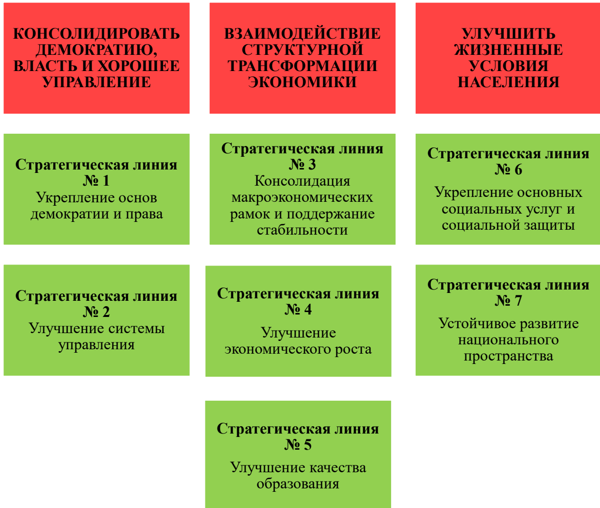
Рисунок 3: Структура проекта Р.А.Г. (программа действия правительства Республики Бенин 2016-2021)

Источник: Иллюстрация составлена автором.