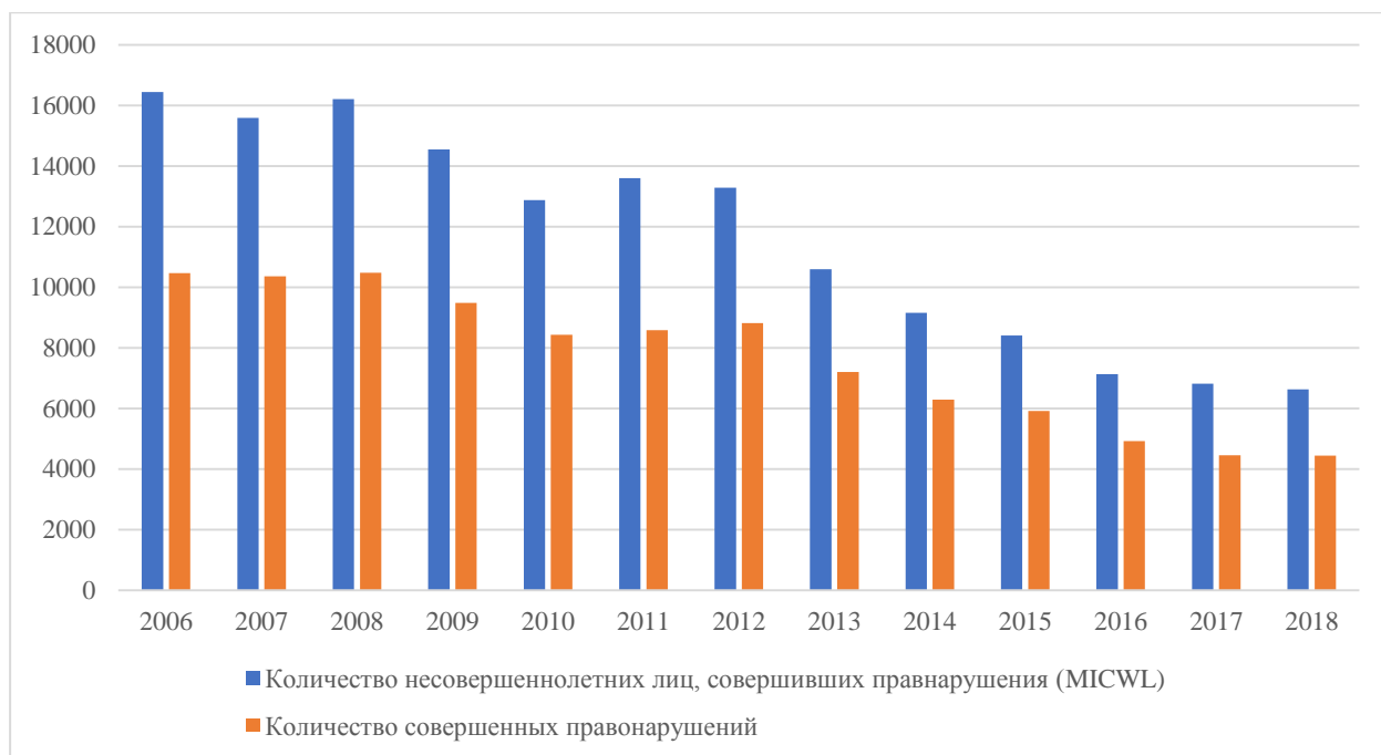
Диаграмм 1. Количество несовершеннолетних лиц, совершивших правонарушения в СРВ, и количество этих правонарушений в период 2006-2018 гг.

Категория несовершеннолетних, совершивших правонарушения (преступления и административные проступки), в англоязычной литературе определяется аббревиатурой MICWL – Minors In Conflict With Law).