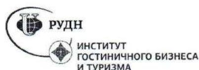
Рисунок 3 – Логотип ИГБ и Т РУДН

При составлении списка использованных источников необходимо соблюдать определенную последовательность в перечислении библиографических записей. Для отчета по практике наиболее приемлемыми являются алфавитные библиографические списки.