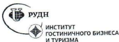
Рисунок 3 – Логотип ИГБ и Т РУДН

При составлении списка использованных источников необходимо соблюдать определенную последовательность в перечислении библиографических записей. Для отчета по практике наиболее приемлемыми являются алфавитные библиографические списки.