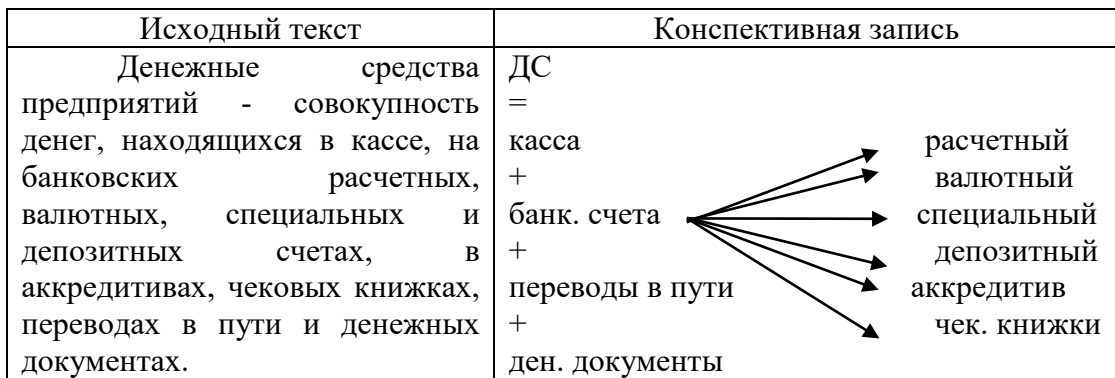
Рис. 1. Пример конспективной записи текста

Для написания конспекта лекций необходима тетрадь (отдельно на данный предмет). Страницы тетради надо пронумеровать и сделать оглавление. Необходимо отделить широкие поля для дополнений, заметок и т.п. На титульном листе могут быть размещены следующие сведения: наименование дисциплины, фамилия, инициалы автора, группа и др.