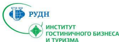
Рисунок 3 – Логотип ИГБ и Т РУДН

При составлении списка использованных источников необходимо соблюдать определенную последовательность в перечислении библиографических записей. Для отчета по практике наиболее приемлемыми являются алфавитные библиографические списки.