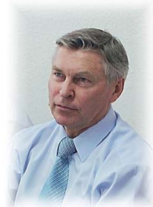
Ректор РУДН, академик РАО, Председатель ВАК РФ В.М. Филиппов