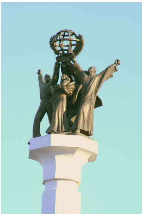
Одна из исторических достопримечательностей РУДН - статуя около Главного корпуса.

В РУДН обучаются студенты из 131 страны мира, представители более чем 450 народов и национальностей, в том числе свыше 1000 человек – представители российских национальных образований и около 4000 иностранных граждан. Он был учреждён в 1960 году и с 1961 по 1992 гг. назывался УДН имени Патриса Лумумбы. В 1975 г. Университет был награждён орденом Дружбы народов за заслуги в деле подготовки кадров специалистов для стран Азии, Африки и Латинской Америки.