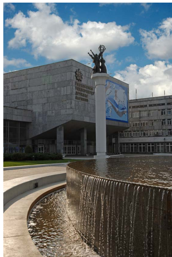
Добро пожаловать!

верситетов Европы и Центральной Азии, Академической сети университетов стран Восточной и Южной Европы, принимает участие в деятельности организации университетов стран Черноморского бассейна, участник Зальцбургских семинаров (Австрия) работников высшей школы. В 2000 году в Университете была открыта кафедра сравни-