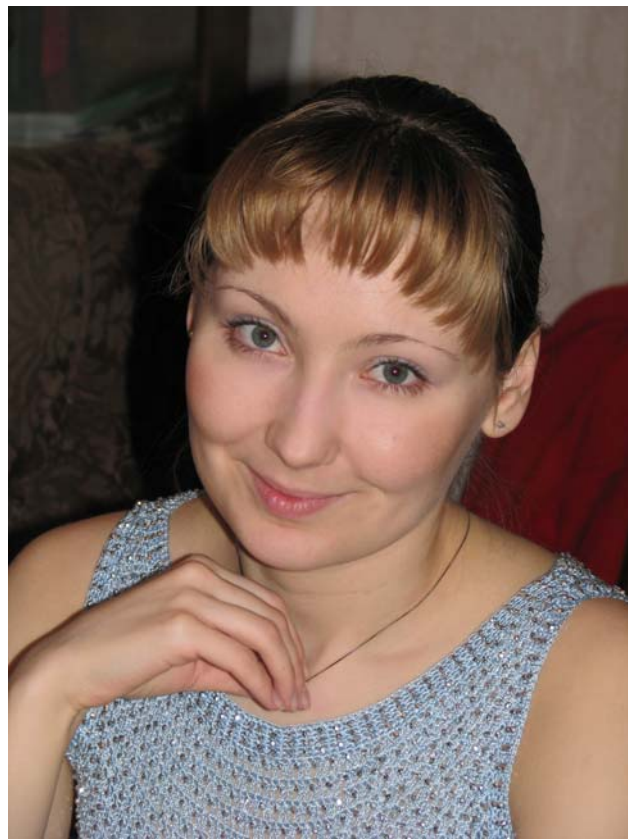
Полина Силаева. Фото из архива

Полина немного играет на синтезаторе и гитаре, катается с мужем по выход-