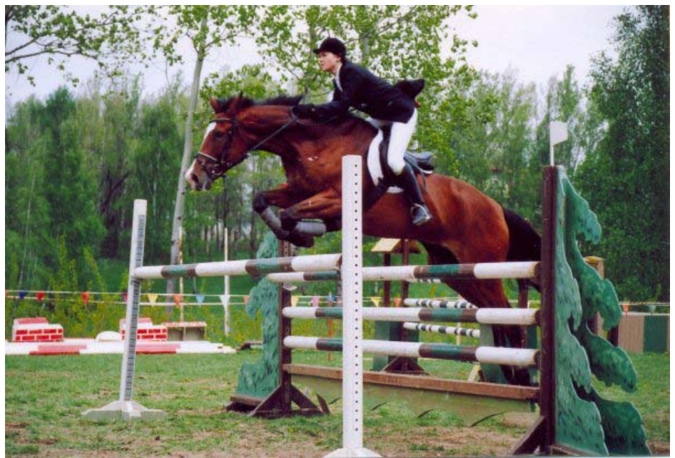
Вероника Шишигина. Фото из архива

нять. К тому же, после такого обилия математики и технических дисциплин в различных