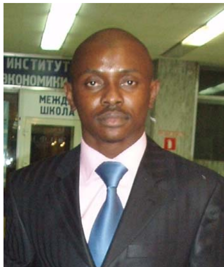
Патрик Геде Анж.

Когда он поступил в Университет, он ничего не знал о России. Но благодаря РУДН, он познакомился с боль-