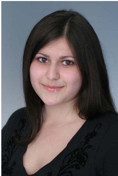
Сусанна Аванесова.

Сейчас эта целеустремленная девушка имеет несколько интересных предложений по поводу работы в Испании и Великобритании, но думает работать в