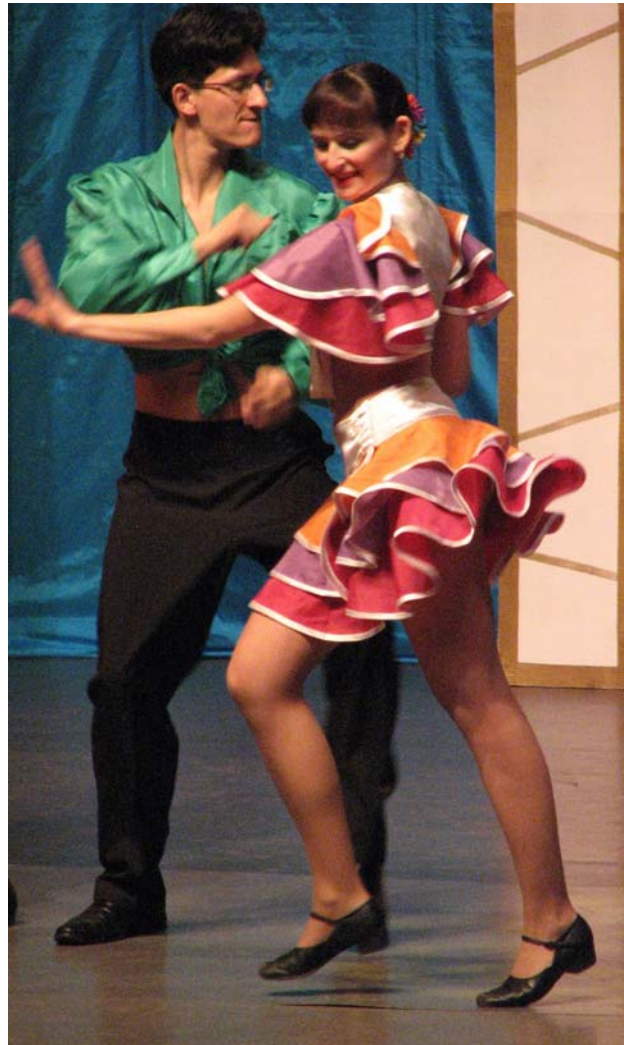
Задорный танец Ритмов дружбы.

Развитие интеллектуальной составляющей студенческого досуга стало одним из самых пер-