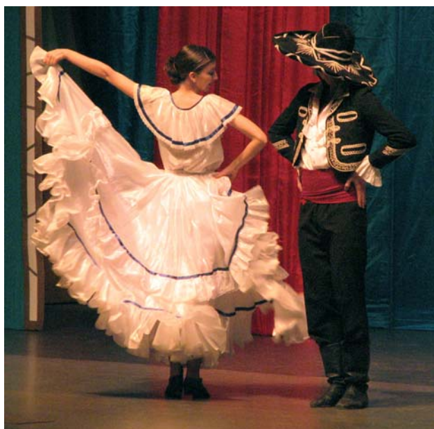
Латиноамериканский танец кумбия.