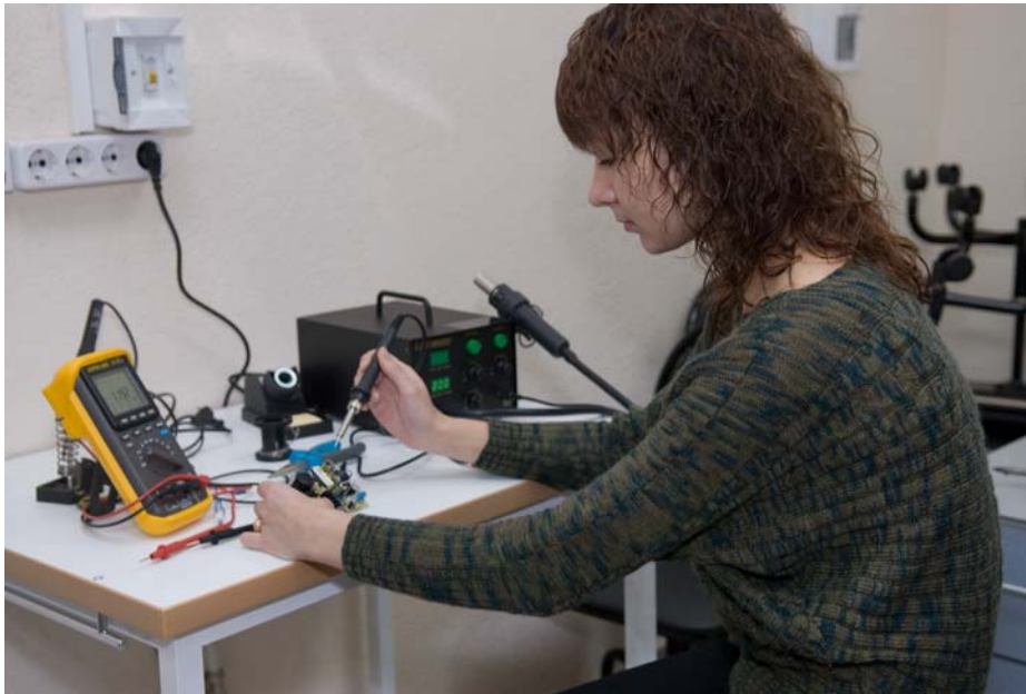
На физмате девушки не хуже ребят справляются с современным оборудованием.

лавр-магистр». Направления подготовки включают: математику и прикладную математику, прикладную математику и информатику, прикладную математику