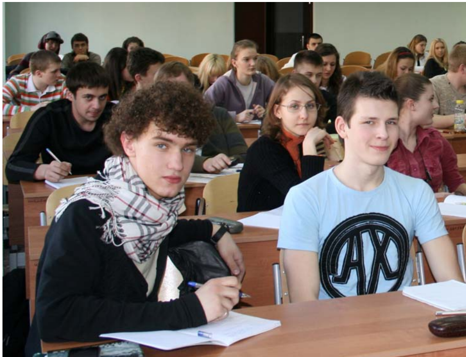
А ты знаешь про Уникум?