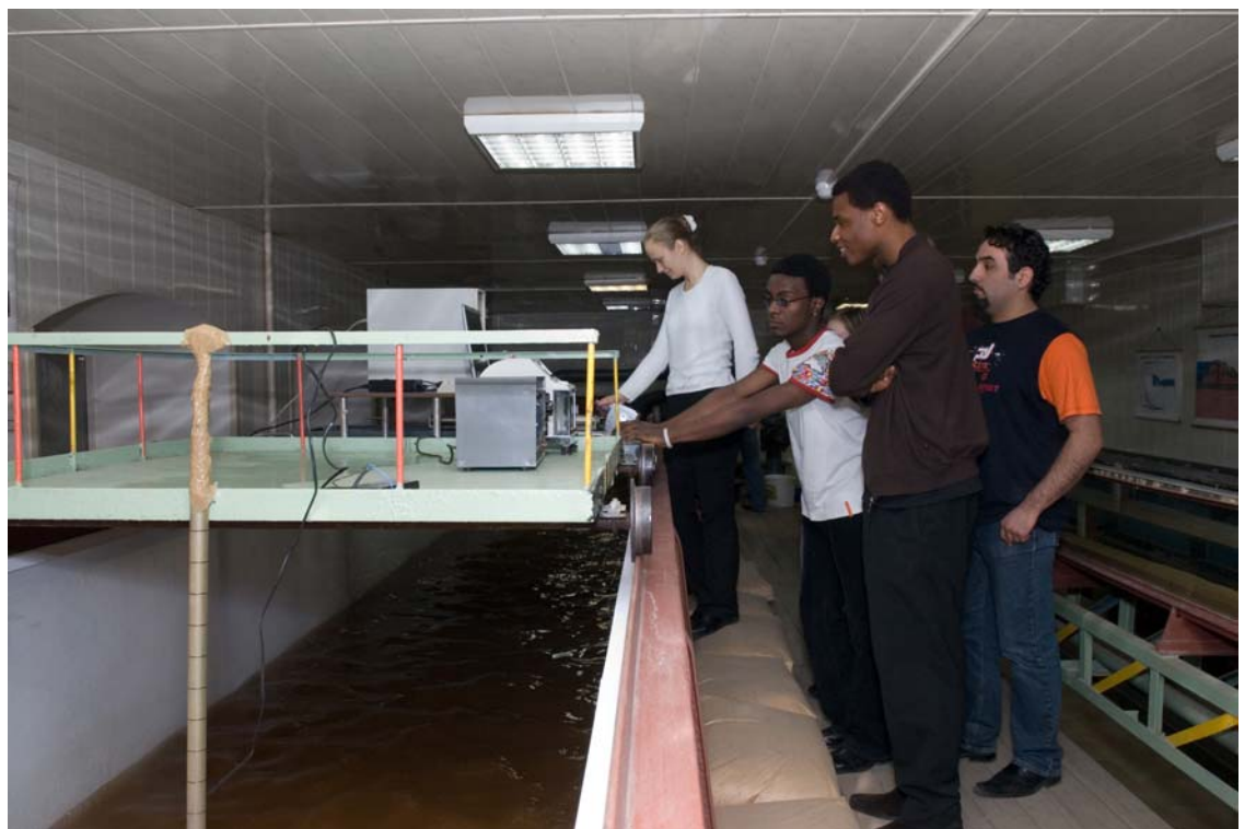
Студенты-инженеры набираются опыта на гидросооружениях.

- Все дело в нескольких принципиальных отличиях, – говорит Николай Константинович. – Во-первых, это уровень языковой подготовки. У нас он на порядок выше, чем в других. Это особый, «технический» язык, помогающий выпускникам успешно работать за границей. Во-вторых, современный специалист должен быть сведущ не только в своей узкой области, но и быть всесторонне развитым. Недавно ко мне приходил человек, который хотел взять на работу за границу наших выпускников, просил совета. Говорил, что никто лучше них не приживается в другой стране. Помогает дух космополитизма и толерантности, царящий у нас. Бывшие студенты из других стран, учившиеся когда-то здесь, отправляют сюда своих детей и даже внуков, не доверяя ни американским, ни немецким вузам.