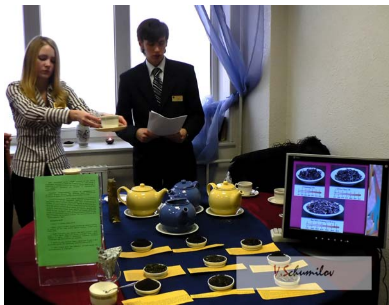
Welcom to ИГБит.

Одна из эффективных форм обучения в ИГБит - «Ресторанные форумы». На них решается задача соединения знания и навыков студентов в одно целое, создание общей модели своего ресторанного