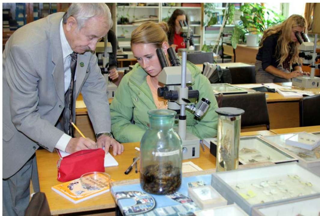
Практическое занятие на аграрном факультете.

- На самом деле у нас на факультете все ребята