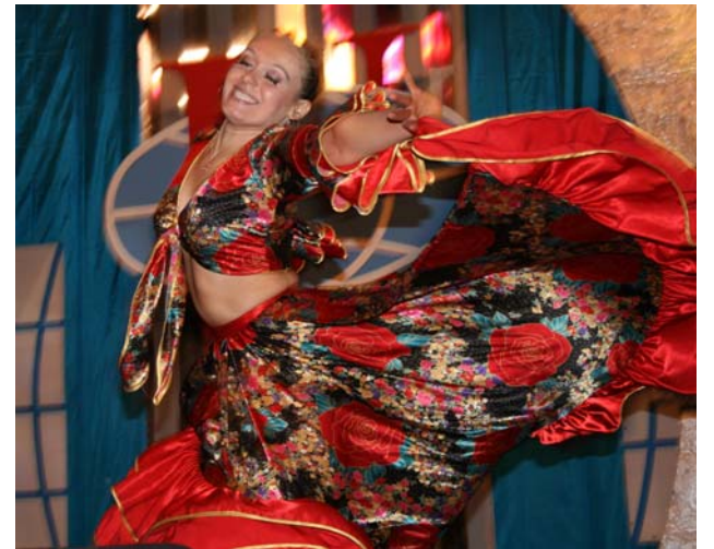
Темпераментная цыганочка.

спективных направлений деятельности Интерклуба. На базе созданного в 1999 году Клуба интеллектуальных игр в Университете ежегодно проводится турнир по игре «Что? Где? Когда?», сборные команды РУДН постоянно участвуют в