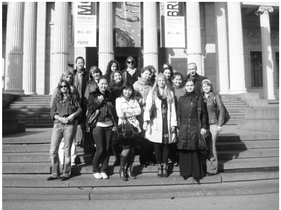
Студенты РУДН на ступеньках Государственного музея изобразительных искусств им. А.С. Пушкина.

А вот, что нам рассказала Чжень – студентка, приехавшая из Китая: