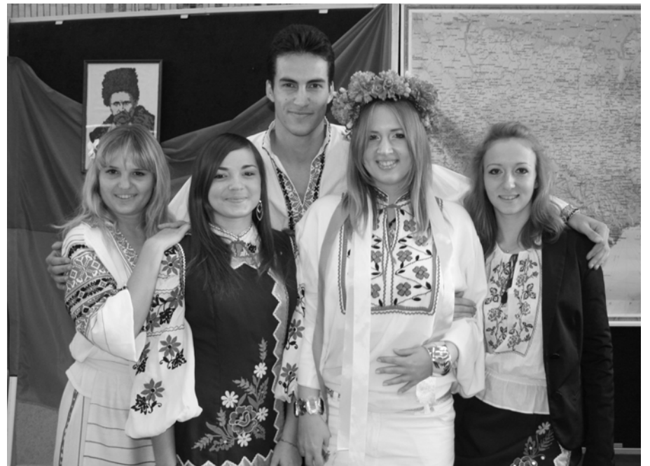
Гостей выставки встречали студенты в национальных украинских костюмах.