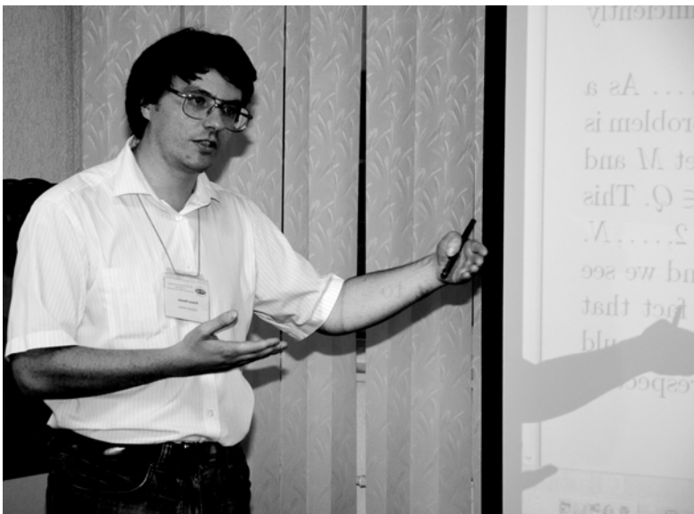
Роман Шамин.

оборудование, оргтехнику и лицензионное программное обеспечение. Возникла возможность проводить расчеты прикладных задач большой размерности, что