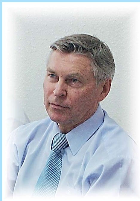
Ректор РУДН, Председатель ВАК РФ, академик В.М. Филиппов