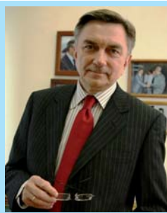
Корчагин Юрий Петрович. Чрезвычайный и Полномочный посол РФ в Испании. Выпускник историко-филологического факультета 1977 г.

Ганеш Шах. Министр по охране окружающей среды, науке и технике Непала. Выпускник инженерного факультета 1973 г.