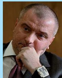
Клишас Андрей Александрович. Член Совета Федерации Федерального Собрания РФ. Выпускник юридического факультета 2000 г.

Мария Луиса Рамос Урсагасте. Посол Многонационального государства Боливия в РФ. Выпускница сельскохозяйственного факультета 1991 г.