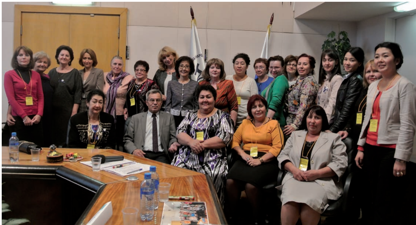
Конкурсанты и организаторы в зале заседаний Ректората

Конкурс организовал факультет повышения квалификации русского языка как иностранного при поддержке Министерства образования и науки РФ. В Москве состоялся лишь финальный тур, а отборочные этапы проходили в странах СНГ в марте и апреле в рамках «Недели русского языка». В каждой стране-участнице жюри выбрало трех победителей, которые были приглашены на финальный этап в Москву. Участниками заключительного тура стали 15 учителей-русистов из Армении, Казахстана, Киргизии, Таджикистана, Абхазии, Приднестровья и Грузии. Стоит отметить, что в финале оказались только представительницы прекрасного пола.