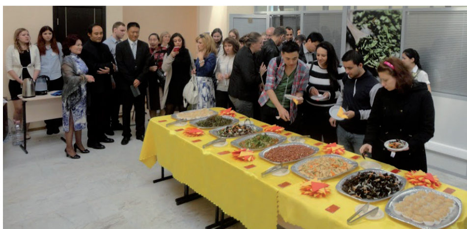
Обед из восточных блюд