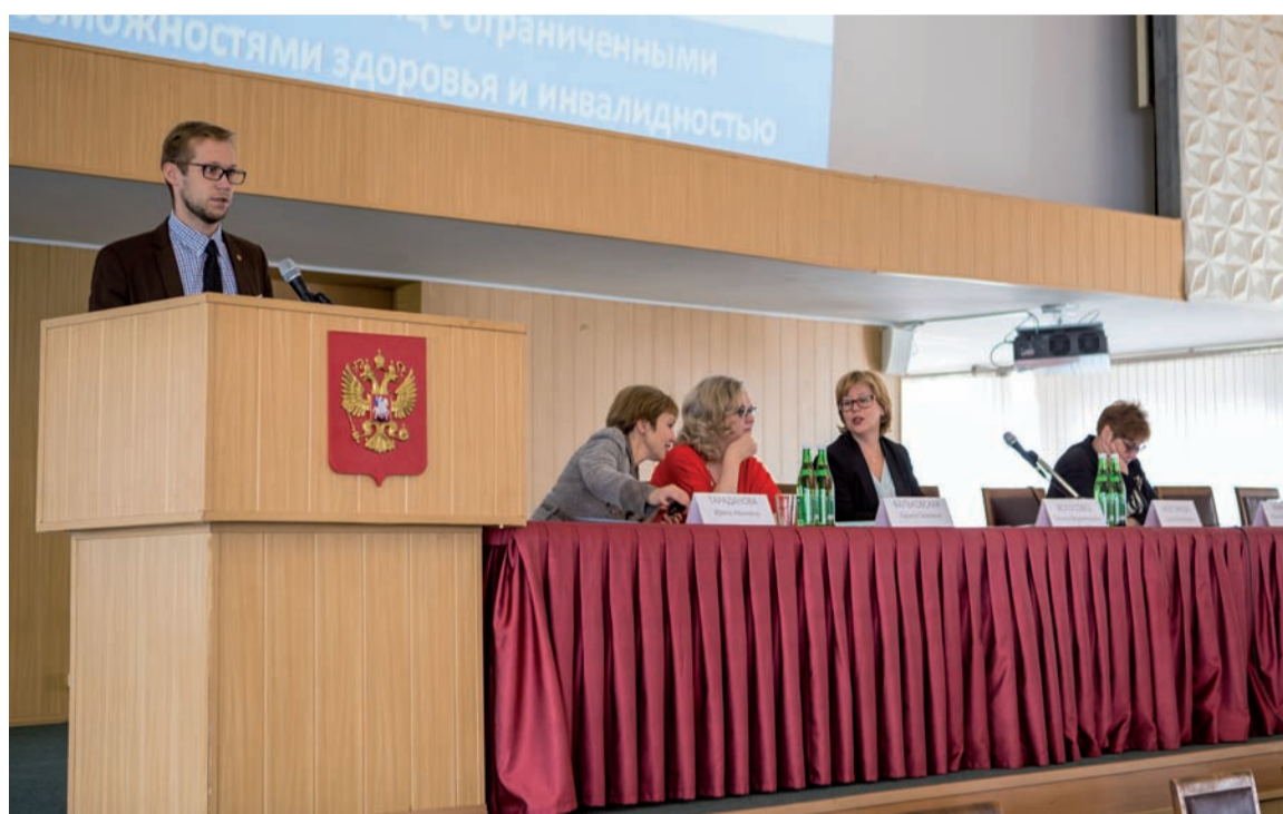
Пленарное заседание в Министерстве образования и науки РФ

Именно так в своей лирической эпиграмме говорил о детях С.Я. Маршак. В этой же эпиграмме он также констатировал: «Но вряд ли в жизни пригодится тот, кто, жить готовясь, в детстве не живет». Эта фраза прекрасно иллюстрирует состояние инклюзивного образования в России.