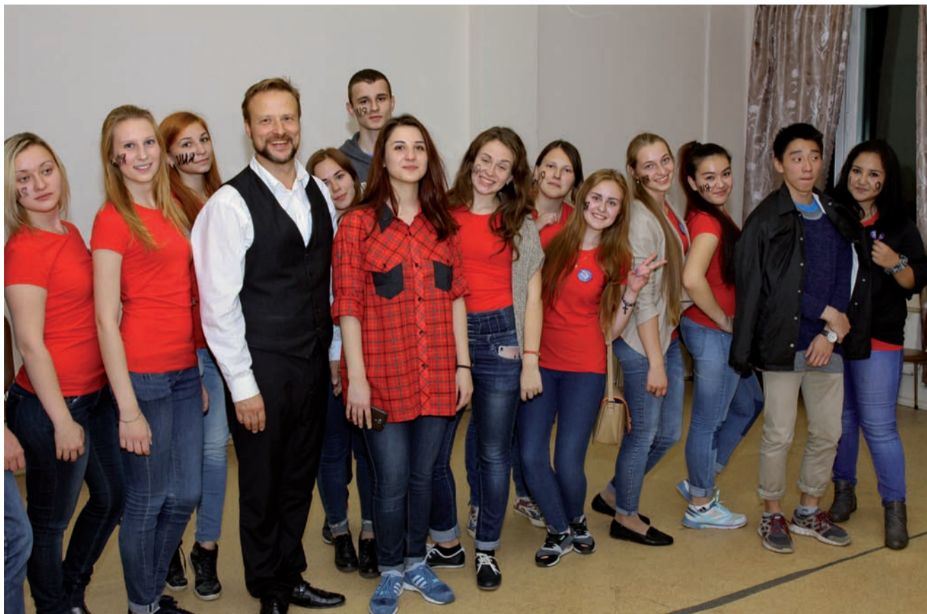
На одном из этапов квеста

Всего в «Интерквесте» приняли участие 13 факультетов и институтов РУДН. Над командами первокурсников взяли шефство ребята из студактива Интерклуба.