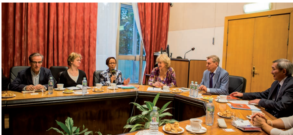
Делегация университета Париж-VIII на приеме у Ректора

Делегация французского университета уже имеет опыт плодотворного взаимодействия с другими вузами России: Российским государственным гуманитарным университетом и Московским гуманитарным университетом. Обсуждение проходило в рамках международных магистерских программ двойного диплома.