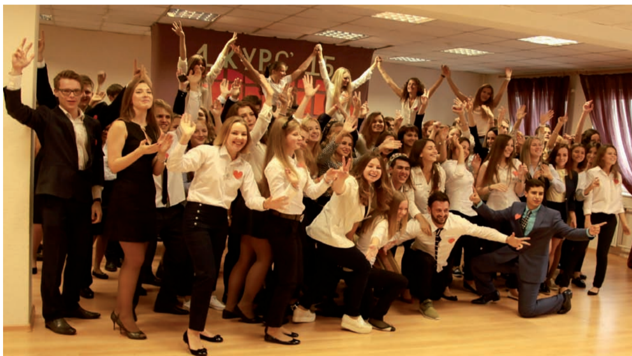
Счастливые первые курсы ИГБиТ

Мы многое узнали об Институте, нашем Российском университете дружбы народов, его миссии высокого служения знаниям, интернационализму, дружбе разных народов.