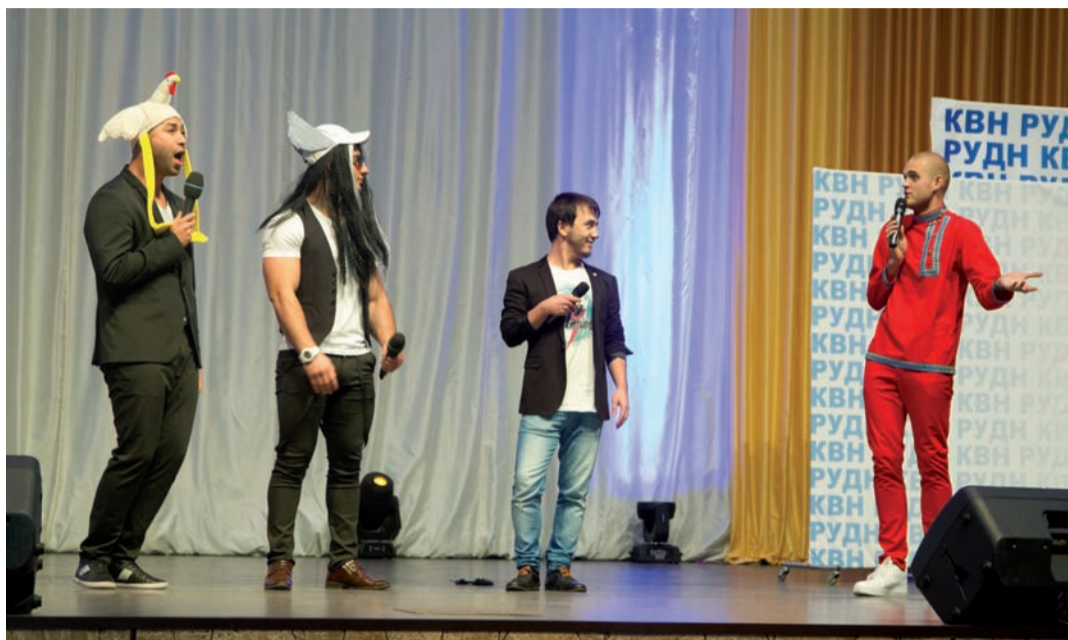
Команда «Чистые пруды»

24 сентября в Актовом зале Главного корпуса Российского университета дружбы народов состоялся первый полуфинал внутреннего кубка РУДН, в котором приняли участие команды «Ассортимент», «Чистые пруды» и «Сборная приезжих».