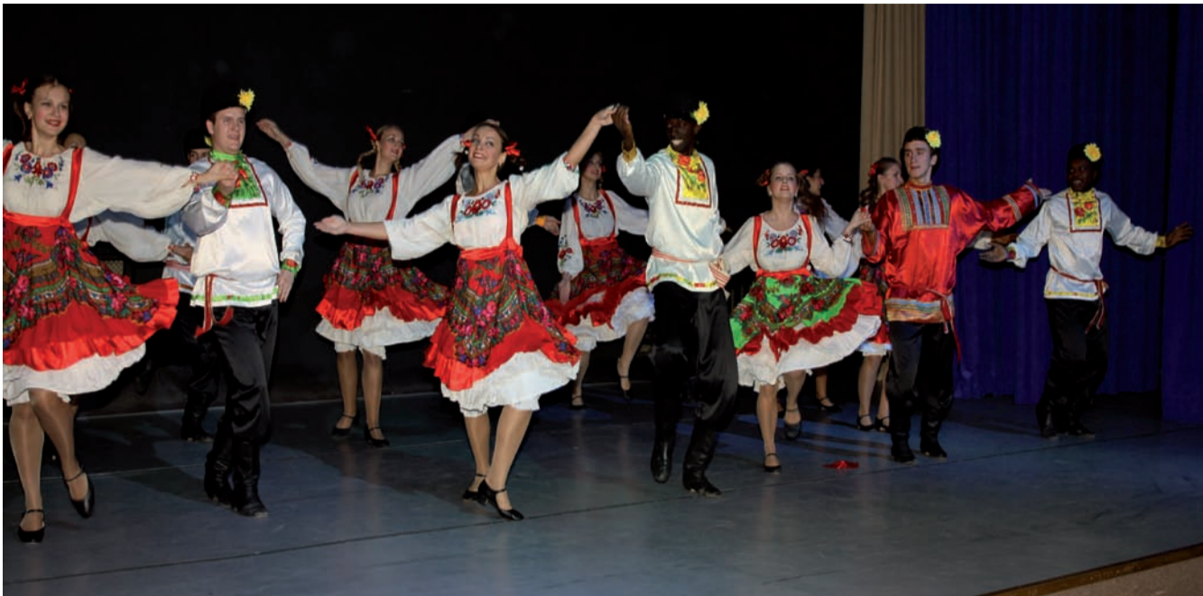
Концерт. Выступление «Ритмов дружбы»

дий, которые подготовили разнообразные задания для команд. Несмотря на то, что прохождение квеста заняло больше двух часов, все команды были полны энергии и положительных эмоций. После игры все группы в полном составе собрались в Актовом зале Интерклуба, чтобы узнать имена победителей.