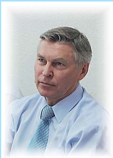
Ректор РУДН, академик РАО В.М. Филиппов

С течением времени количество участников форума неизменно растет, равно как увеличивается и число иностранных студентов, которые приезжают учиться в Россию. Так, например, в 1993 году в Университете обучались примерно 3 тысячи иностранных студентов из 109 стран мира. Сегодня в РУДН получают высшее образование порядка 6 тысяч человек из 146 государств. И ведь это только в РУДН - иностранные граждане приезжают учиться и в другие вузы нашей страны. Это свидетельствует о востребованности российского образования, которое высоко ценится в мире. Форум объединяет выпускников российских вузов из разных стран, что помогает пропагандировать российское образование в мире.