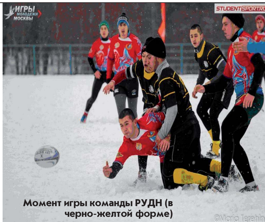
Момент игры команды РУДН (в черно-желтой форме)

В первый день зимы на старт вышли 6 сильнейших студенческих сборных команд Москвы. Ожидалась упорная борьба за почетное звание победителя. Получить такое звание очень нелегко. Особенно когда твоими противниками являются сильные и достойные команды. Это доказал стартовый матч между командами МИЭТ и МАИ, в котором верх одержали игроки из Зеленограда со счетом 17:14. Далее в игру вступила вторая команда МИЭТ, которая уступила РУДН со счетом 0:33. Матч следовал за матчем, игроки и команды сменяли друг друга... И вновь первая команда Зеленограда вышла на заснеженное поле. Победа МИЭТ над командой МАИ в этой игре давала путевку в финал второго тура. Поэтому ребята из вуза электронной техники хорошо настроились и одержали уверенную победу со счетом 22:0. В последнем матче первой группы МАИ уверенно разделался с Финансовым университетом, обеспечив себе как минимум третье место в итоговом