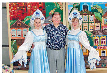
М.В.Горбаневский на празднике славянской письменности.