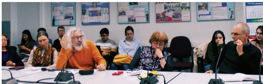
Научный семинар «Немецкое и русское неокантианство»

Сейчас прошло шестое заседание. Мы начали с докладов преподавателей нашего факультета, потом у нас были иностранные гости. Например, польский профессор из Катовицы, не-