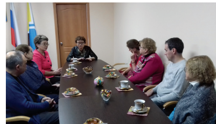
С министром образования Тывы

дагогические экспедиции в Северо-Кавказский федеральный округ и в Республику Тыва показали, что учителя школ плохо знакомы с современной наукой. Именно поэтому возможность живого общения со специалистами привлекло в Чеченской Республике около 800 участников, в Республике Дагестан — около 500 участников, а в Тыве — более 400 человек.