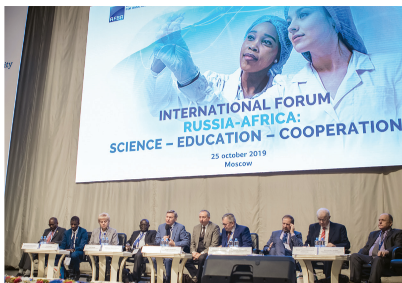
Саммит «Россия – Африка»

В рамках Саммита «Россия-Африка» в октябре 2019 г. в Сочи подписано соглашение между РУДН и Госкорпорацией «Росатом», которое позволит ее опорным вузам и нашему университету объединить усилия в части популяризации российского ядерного образования за рубежом, продвижения российских образовательных программ и технологий по атомным и смежным специальностям в странах-партнерах Госкорпорации «Росатом», привлечения иностранных абитуриентов из этих стран для обучения в российских вузах. Генеральный директор «Росатома» Алексей Лихачёв заявил: «Многолетний опыт работы РУДН на Африканском континенте и проекты Госкорпорации «Росатом» в рамках гуманитарного сотрудничества позволяют совместными усилиями не просто повысить интерес к российскому ядерному образованию, но также оказать содействие развитию национальных систем ядерного образования и подготовки кадров в Африке».