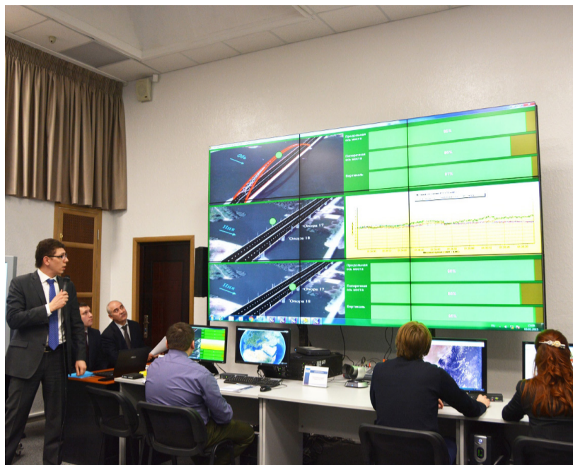
Учебный центр управления полетами РУДН

Мы рассчитываем новые типы орбит и орбитальных структур спутниковых систем, новые траектории космических аппаратов (например, для реализации таких наиболее актуальных миссий, как полеты на Луну и на Марс). Кроме этого обсуждаются вопросы полетов к астероидам. Например, необходимо совершить облет группы астероидов. Задача участников – рассчитать траекторию с минимальным расходом топлива. По данному направлению совместно с Французской инженерной школой мы создали программу двойных дипломов. Кроме этого совместно с предприятиями космической области мы разрабатываем специальное математическое обеспечение для проектирования орбит космических аппаратов и их управления.